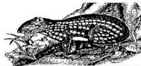
Ilustración n° 2: Conejo pintado (Agouti paca)

Ni gã krõro ñagare nere ya niebare kue suguia ye. Nan amlen suguia güe Nici ügalin kãteri jai ñara ngonlienre.